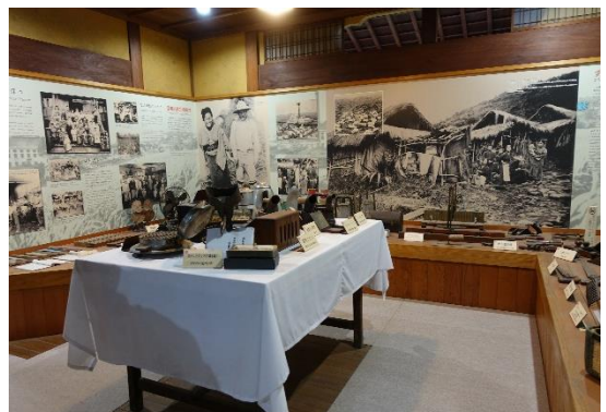
周防大島町の日本ハワイ移民資料館(内部)

江戸時代中期以降、人口が増えた大島郡(周防大島)では、伝統的に大工、石工、船乗りなどの出稼ぎが盛んでした。明治10年(1877)の西南戦争後、インフレが激しくなると不況により生活が困窮し、さらに明治16年の干害、17年の高潮、19年の郷の坪災害と相次ぐ災害が拍車をかけました。こうした中、明治18年に政府主導の官約ハワイ移民が始まり、第1回の渡航では全国で944人、その中でも特に大島郡の人は305人を占めていました。明治18年~27年の官約移民の時代を通じては、全国で29,084人、うち山口県で10,424人、大島郡からは3,914人がハワイへ渡っています。後に民間主導の移民時代になっても、先に移住した親戚や知人の影響もあって、多くの大島郡の人々がハワイやアメリカ本土へ渡り、大島は「移民の島」として知られるようになりました。