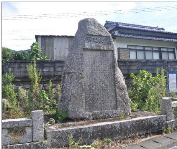
郷の坪の「罹災之碑」(山口県周防大島町東屋代郷の坪)

土石流発生の際に、久保川は下流で二つに分かれ屋代川に注いだと言われます。その新たな川の合流点付近に、明治22年、罹災之碑(通称、千人塚)が建立されました。碑文には、被害の概数、災害発生状況とともに、550年前(建立当時)にも土石流災害がありまた繰り返されたこと、山林や地質に関する学問・研究も進んでいるので、予防のための対策を講じる必要があることなどが刻まれています。