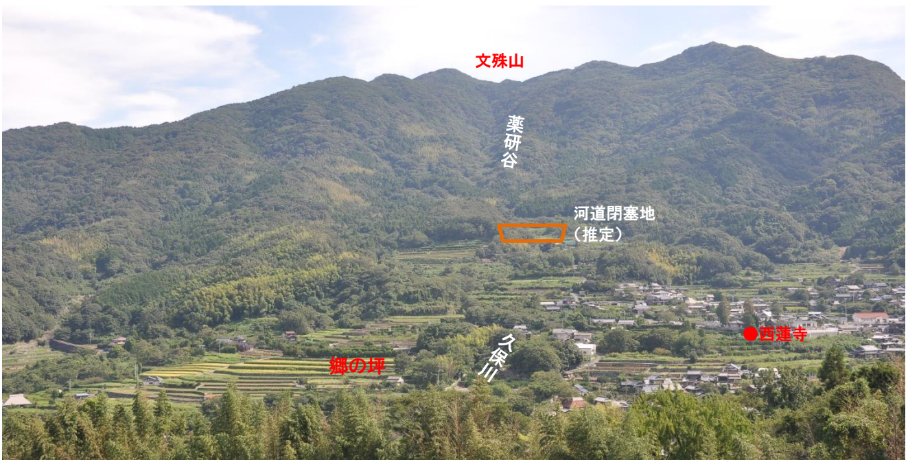
現在の郷の坪付近の景観 (手前、竹やぶの陰を屋代川が右から左に流れる。「罹災之碑」は久保川と屋代川の合流点付近)