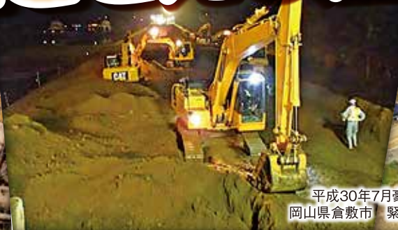
平成30年7月豪雨災害 岡山県倉敷市 緊急復旧状況