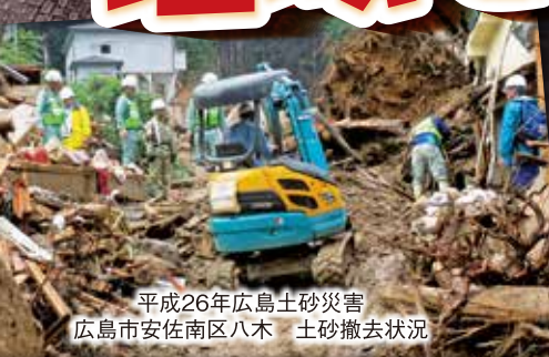
平成26年広島土砂災害 広島市安佐南区八木 土砂撤去状況